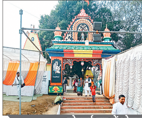
मोहलई पार में भोजन मंडारा

मोहलई पार में भोजन मंडारा गौरैया मेला के एक क्षेत्र मोहलई पार में श्रद्धालुओं के लिए भोजन मंडारा का आयोजन किया गया है। इसके अलावा यहां चौका आरती भी की जाएगी। सांस्कृतिक कार्यक्रमों का भी आयोजन होगा