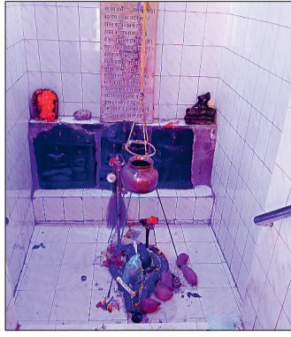
लाटाबोड़